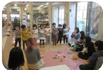
入園お祝いの会(新入园児)