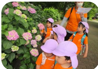
あじさい遠足(4,5 歳児)