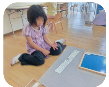
モンテッソーリ活動