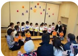
☆0 歳児成長を喜び会