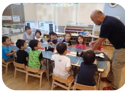
絵画 (3, 4, 5 歳児)