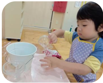
モンテッソーリ活動