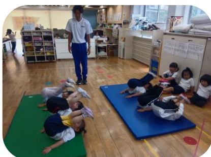
体育指導 (3, 4, 5 歳)